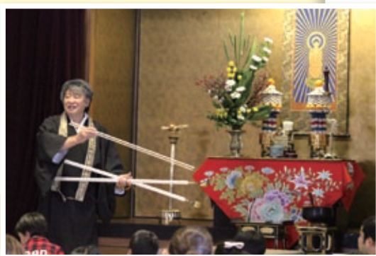
2016年子ども報恩講のつどいにて

天井に大きなシャンデリア。テーブルをはさんで、向かい合って食事するようになっていました。ものすご ご いごちそうの山でお肉もお魚もお菓子もなんでもそろっています。ところが、地獄の人たちはみんなやせ細り、「悲しいよー」「苦しいよー」と泣いているんです。よく見ると、地獄の