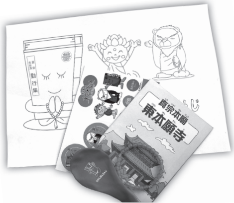
子ども参拝記念品