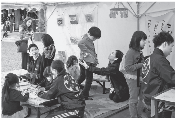
子ども参拝案内所