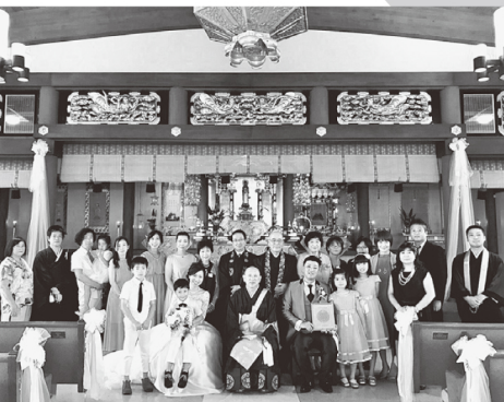
【仏前結婚式】 豊かな自然の中ハワイでは、日本の方々が式を挙げる人が多い。