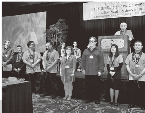
【世界同朋大会】 海外・日本の門徒が一堂に集う。(2016年8月 第12回大会・北米)