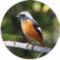
ジョウビタキ Daurian redstart

渉成園で 見られる鳥 Birds you can see at Shosei-en