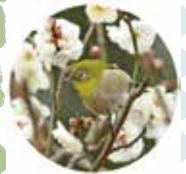
メジロ Warbling white-eye