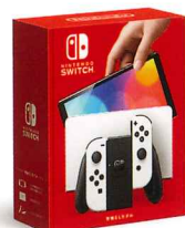
Nintendo Switchのロゴ・Nintendo Switchは任天堂の商標です。